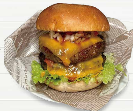
ダブルパティ チェダーチーズバーガー Double patty Cheddar cheese Hamburger.