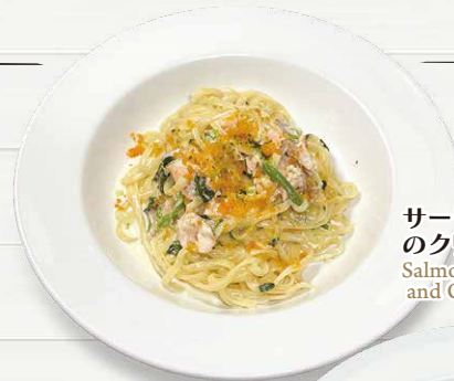
サーモンとほうれん草 のクリームパスタ Salmon, Spinach and Cream sauce.