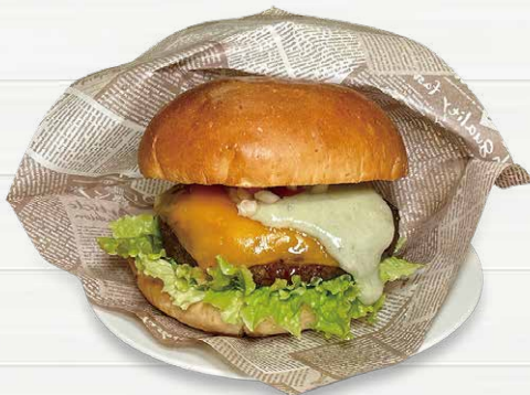
クアトロフォルマッジオ バーガー Quattro cheese Hamburger.