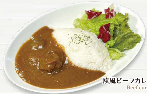
欧風ビーフカレー Beef curry.