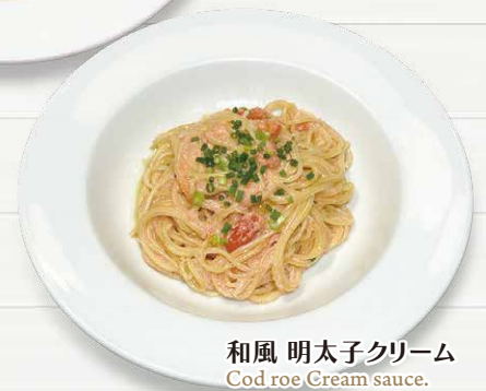
和風 明太子クリーム Cod roe Cream sauce.