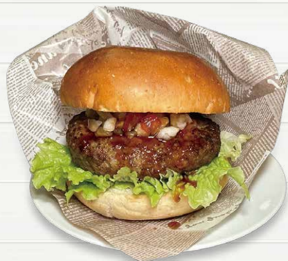
クラシックバーガー Classic Hamburger.