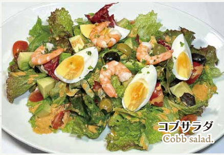
コブサラダ Cobb salad.